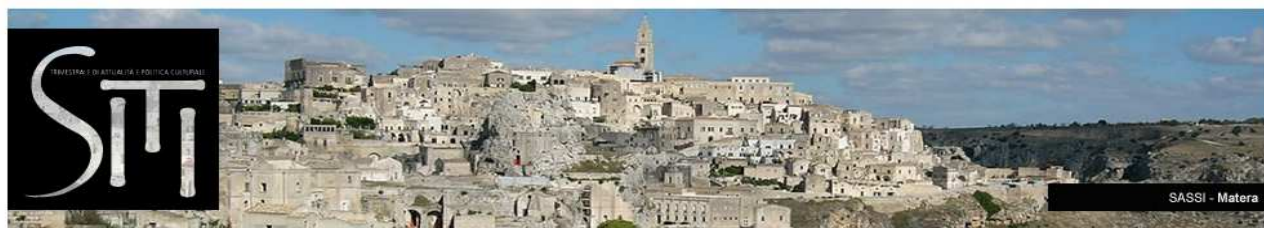
SASSI - Matera

HOME | LA RIVISTA | ASSOCIAZIONE | I SITI ITALIANI | UNESCO | FOTOGALLERY | VIDEOGALLERY | CONTATTI