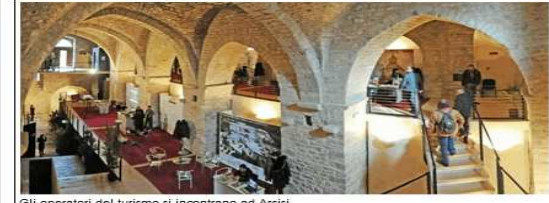
Gli operatori del turismo si incontrano ad Assisi

a cura della Redazione Dal 21 al 23 settembre Assisi torna a essere vetrina internazionale della Borsa del Turismo dei Siti Unesco. Nelle stesse date è attesa la prima edizione delle Giornate della Dieta Mediterranea