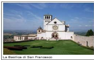
La Basilica di San Francesco