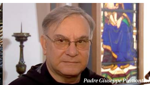
Padre Giuseppe Piemontese