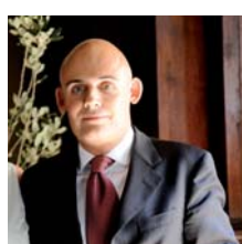
Backpackers World TOUR OPERATOR India by Train Mario Bevione