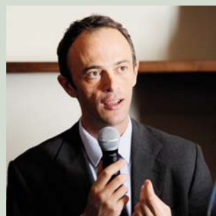
Stanislao de Marsanich Paesaggio Culturale Italiano PARCHI LETTERARI