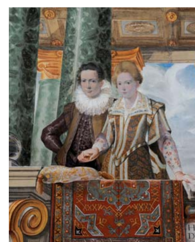
Palazzo Vallemani, Sala degli Sposi, affresco