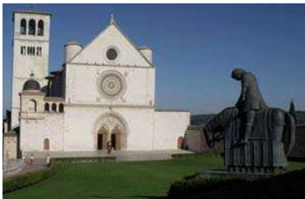
Assisi: Basilica di San Francesco.

L'Italia vanta in questo campo un invidiabile primato: su 939 siti materiali e 232 siti immateriali in tutto il mondo, 50 sono infatti i siti italiani, tra beni materiali e immateriali, ed Assisi, a buon diritto, si può considerare il numero uno.