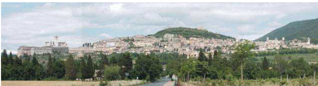
Assisi. Veduta panoramica della città.

Palazzo Vallemani ospiterà la parte scientifica dell'evento con oltre 40 appuntamenti, tra seminari, dibattiti, convegni e workshop ed importanti appuntamenti sui temi dell'anno UNESCO, quali il convegno su "Patrimonio immateriale e identità. Strategie ed azioni della Convenzione dell'Unesco per la salvaguardia del patrimonio culturale intangibile del 2003", il seminario sul modello della Dieta Mediterranea tra politiche alimentari, promozione della salute e cultura dei popoli, che apre la strada a un nuovo progetto firmato WTE, e il convegno sul paesaggio urbano storico con la nuova raccomandazione Unesco per le città del Patrimonio Mondiale.